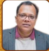
Sol. Adv. Cllr. Baiju Thittala Mayor of Cambridge, U.K